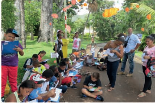
Les élèves en visite à St Denis